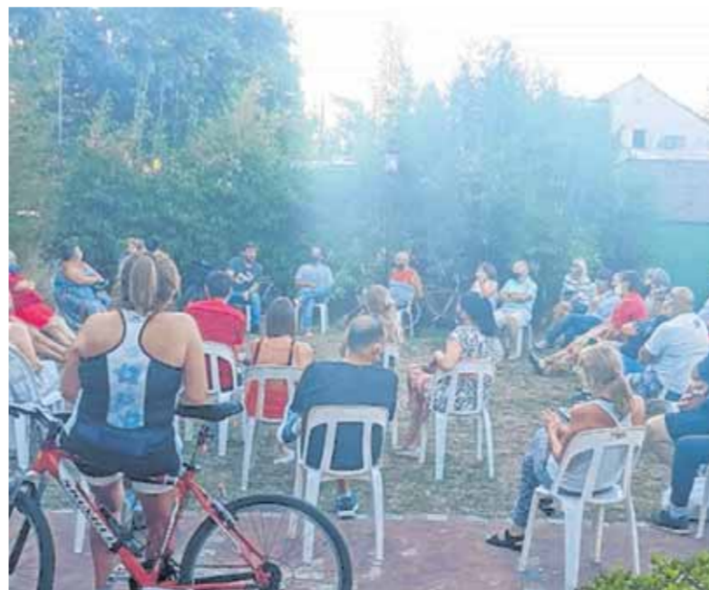
EL ENCUENTRO SE LLEVÓ A CABO EN EL CLUB JUVENIL DE CITY BELL

Por último, indicó que "los vecinos dicen que es poca la cantidad de cuadrículas por el crecimiento del barrio. La gente del Ministerio nos dijo que en marzo iban a poner más patrulleros".