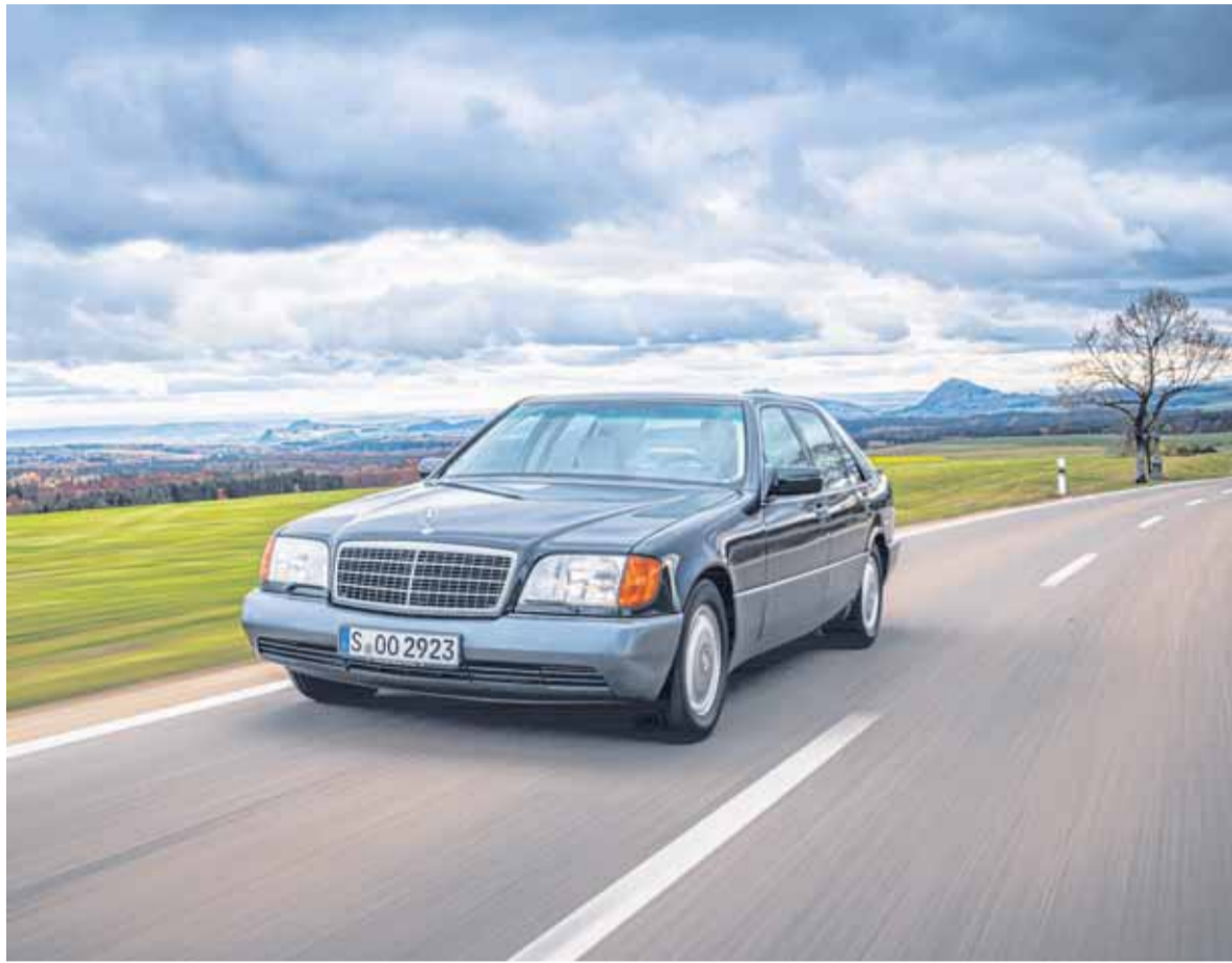
EL MERCEDES BENZ W140 FUE LANZADO EN 1991