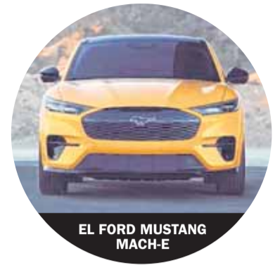
EL FORD MUSTANG MACH-E

En primer lugar, observa Wilke, porque las berlinas no son ni de lejos tan sexies como las coupés o los cabriolets. En segundo lugar, porque el W140 ya disponía de tanta electrónica moderna para aquel entonces que asusta a los aficionados al bricolaje para conservar autos de otras épocas. (DPA)