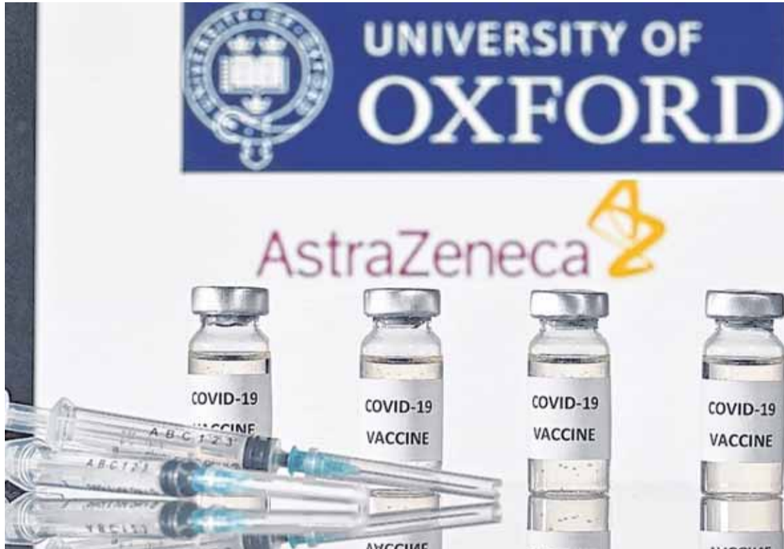
SE ESTIMA QUE LA VACUNA DE OXFORD ASTRAZENECA COMENZARÁ A LLEGAR A LA ARGENTINA EN MARZO/WEB

En este contexto, la empresa envió ayer un comunicado en el que