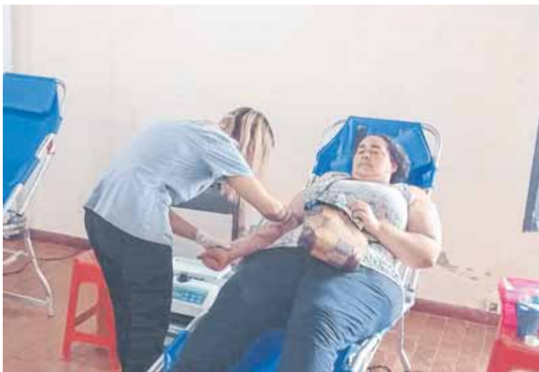
17.500 PERSONAS DONARON SANGRE EN COLECTAS EXTERNAS EN 2020

El otro frente es entre los anestesiólogos platenses e IOMA, después de que en octubre los profesionales rescindieron el convenio que los une, disconformes con los honorarios. "Está denunciando el convenio. Los 122 anestesistas firmaron que no quieren trabajar más por IOMA", se indicó. Si bien esa decisión dejó sin esa cobertura a los afiliados de la Región, el servicio se sostiene, por el momento, por otra decisión judicial que ya fue apelada por la SPA, por lo que recién habría novedades cuando se levante la feria judicial.