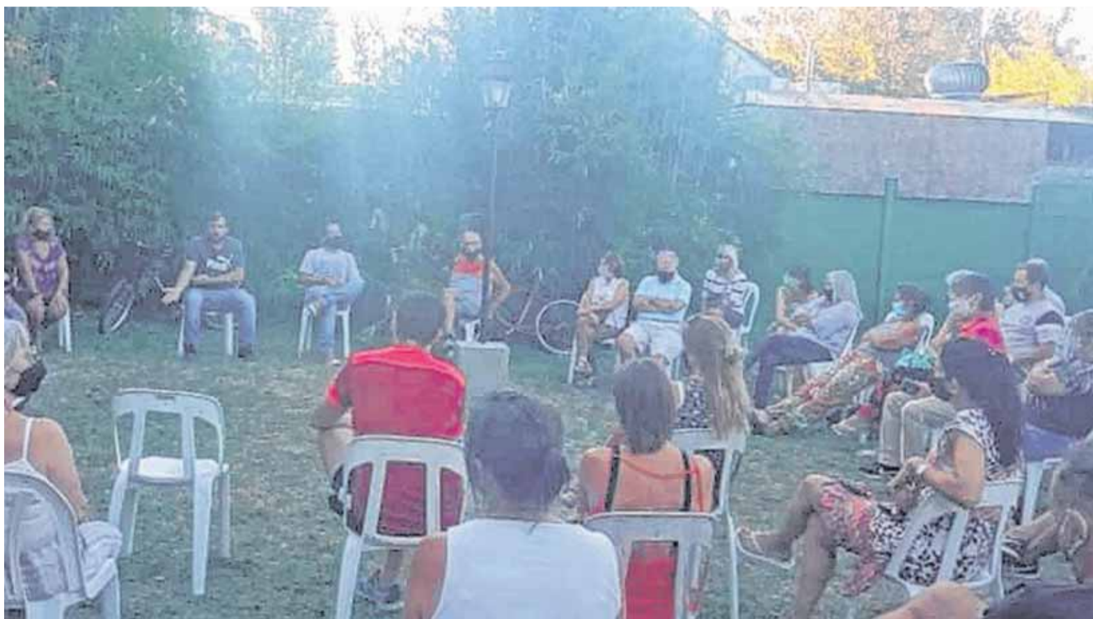
UN PASAJE DE LA REUNIÓN QUE MANTUVIERON VECINOS DE CITY BELL, QUE DENUNCIAN UN INCREMENTO EN LA CANTIDAD DE ROBOS EN ESA ZONA

Vecinos de la zona Norte aseguran que no cesaron los vuelcos, la contaminación y los olores. Por eso, hoy harán un reclamo en el Puente Venecia. Mientras, desde la Comuna afirman que la recuperación del cauce entró en una nueva etapa. PÁG. 12