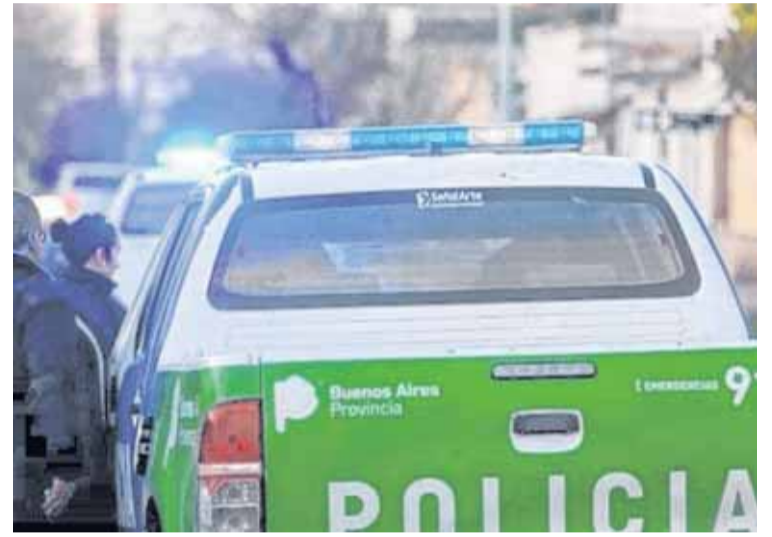
EN EL GARRISMO AFIRMAN QUE EL DELITO AUMENTÓ DESDE NOVIEMBRE/EL DIA

Por eso, en la presentación que prepara la concejal de Juntos por el Cambio reclamará la restitución de la mesa de coordinación de las fuer-