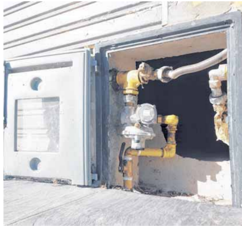
A UNA CARNICERÍA, ENTRARON POR EL GABINETE DEL GAS / EL DÍA