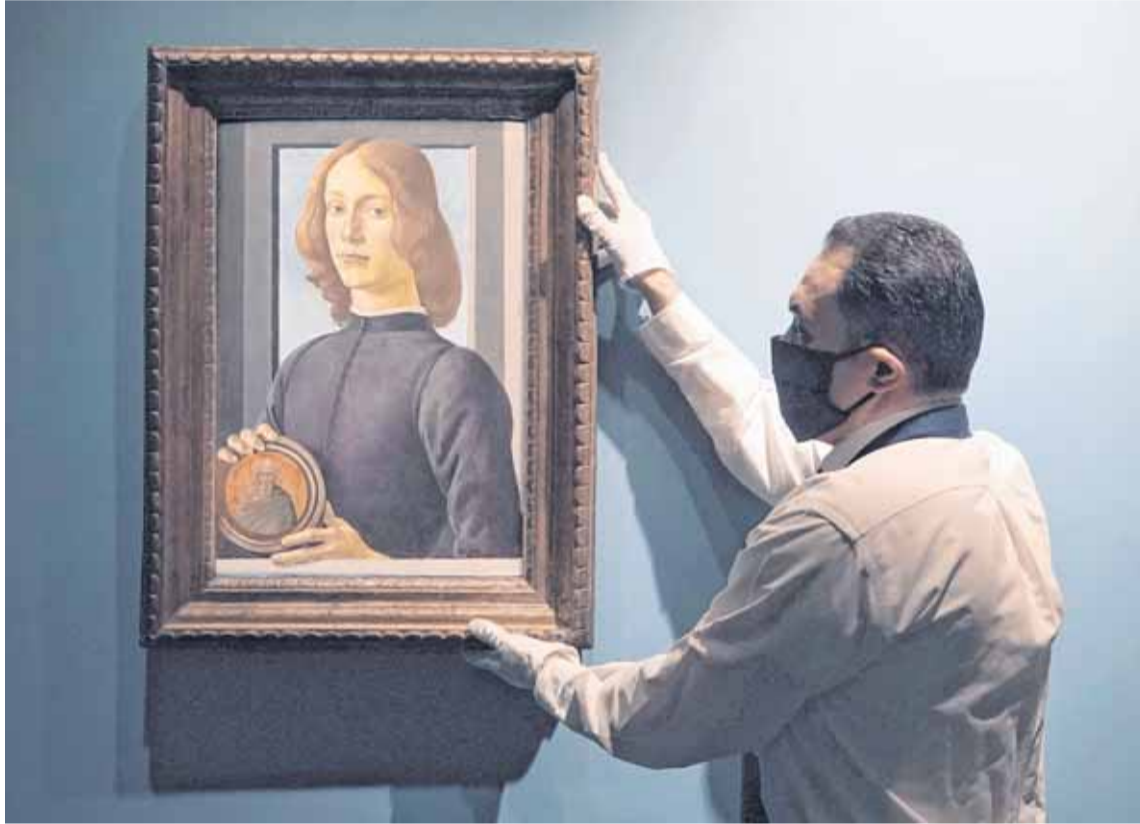
LA OBRA SUBASTADA ES EL ÚLTIMO RETRATO PINTADO POR BOTTICELLI QUE PERMANECÍA EN MANOS PRIVADAS

El cuadro, considerado como uno de los retratos más significativos que hayan salido a subasta, es la obra más cara del artista del Renacimiento subastada y la más