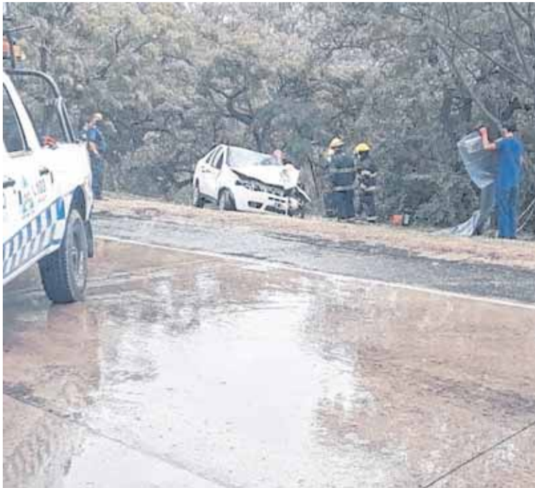
EL CUERPO DEL FALLECIDO DEBIÓ SER RETIRADO POR LOS BOMBEROS