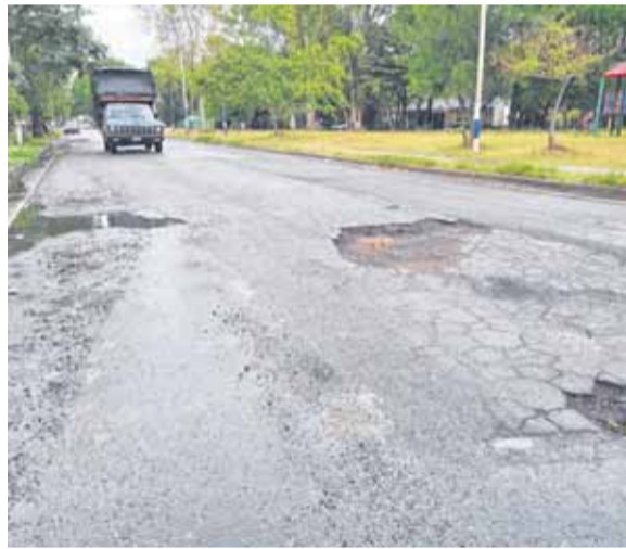
CRÁTERES SORPRENDEN A LOS CONDUCTORES EN 85 Y 12

Así lo planteó Joel desde 16 y 81, donde la cinta asfáltica es apenas una mínima porción de la calle y la mayor parte de la superficie, degradado el material desde hace mucho, es una mezcla de tierra y tosca mal apisonada. “Los que tenemos auto y pagamos impuestos pensamos que no los derivan a hacer los mejoramientos que necesitan los pavimentos. Acá las calles están en estado calamitoso; generalmente ocasionan daño a la amortiguación de los coches. Pasa que cuando hacen un arreglo dura una semana; es nada más un parche”, se quejó el vecino.