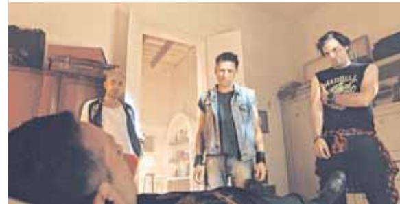
“UNA TUMBA PARA TRES”, PELÍCULA DE MARIANO CATTANEO, QUE LLEGA A LA PLATAFORMA DE CINE.AR PLAY

Tres matones. Un trabajo que sale mal. Una serie de eventos desafortunados que de ninguna manera puede terminar bien. Esa es la premisa de “Una tumba para tres”, una cinta de acción a la vieja usanza, vertiginosa, llena de tiros, con una galería de personajes desquiciados, mucho humor y tres protagonistas bien perdedores, absolutamente superados por las circunstancias.