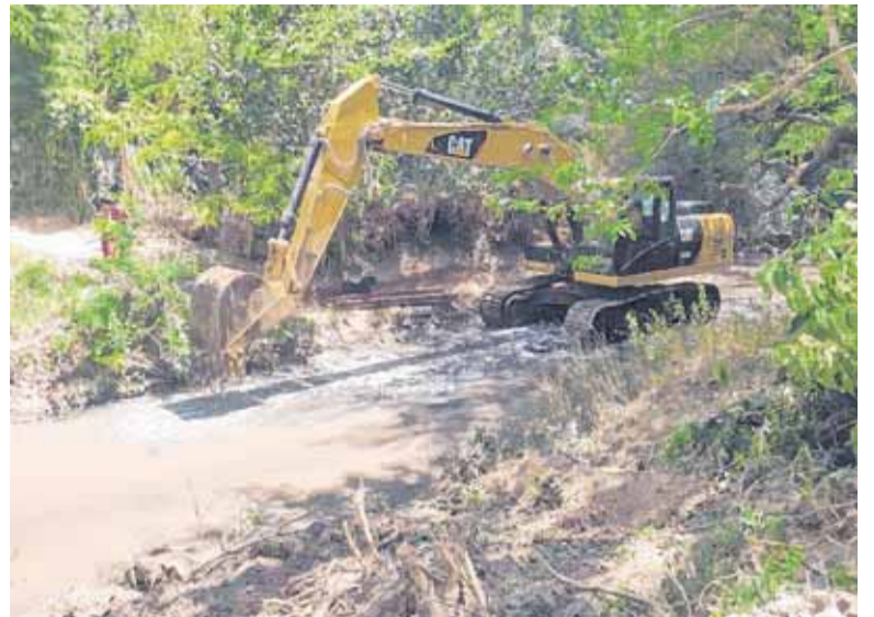
VECINOS DICEN QUE EL AGUA ESTÁ “GRIS”. LA COMUNA, QUE HAY TRABAJOS/ MLP

Según se informó, luego de constatar contaminación en el Arroyo Rodríguez producida por los desechos que se generan, el Municipio y la Provincia intervinieron para instar a los causantes a regularizar la