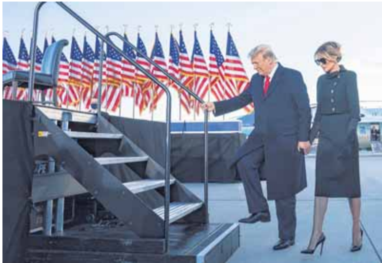
EL FINAL DEL MANDATO DE TRUMP COINCIDIÓ CON LA FUERTE CAÍDA DEL PBI

El resurgimiento en el número de casos confirmados, hospitalizaciones y muertes por el COVID-19 lle-