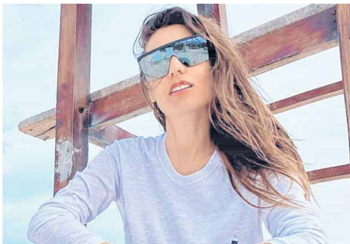
EL RESULTADO POSITIVO DEL HISOPADO DE PAMPITA GENERÓ UN ENORME REVUELO EN LA TELE Y EN LAS REDES / WEB

ARDIERON LAS REDES POR LA ¿IRRESPONSABILIDAD? DE LA FAMOSA