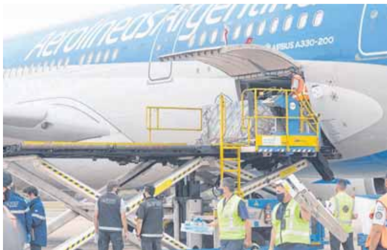
TODAVÍA NO HAY FECHA PARA UN NUEVO VUELO/TÉLAM

La tercera partida de vacunas rusas Sputnik V llegó ayer al país en un avión de Aerolíneas Argentinas que aterrizó a las 12.41 en el aeropuerto Internacional de Ezeiza, tras un vuelo de más de 16 horas procedente de Moscú.