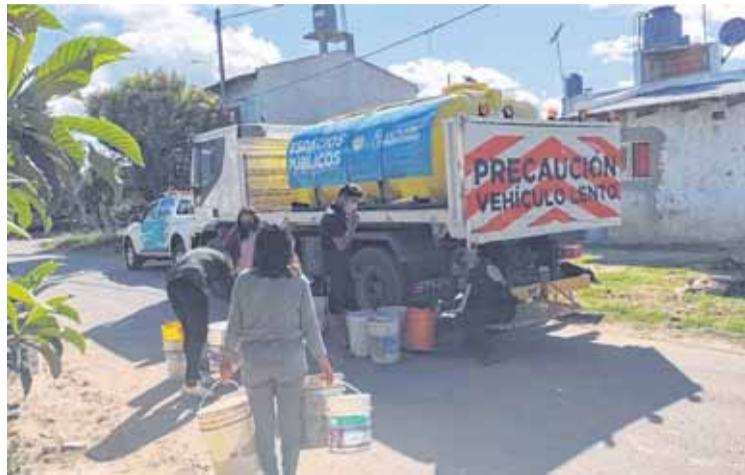
LOS VECINOS DEBEN CARGAR EL AGUA EN BALDES PARA LLEVAR A SUS CASAS

A lo largo de su carrera se perfeccionó con decenas de cursos y dejó plasmado su conocimiento en libros y publicaciones científicas. Además fue socia directora de un estudio de ingeniería hidráulica y sanitaria y trabajó para consultoras en el área hídrica.