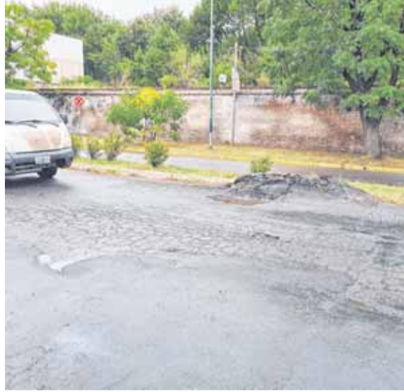
LA AVENIDA 72, EN TORNO AL CEMENTERIO, NO DA MÁS