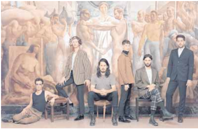
BANDALOS CHINOS VUELVE A REENCONTRARSE CON SU PÚBLICO / NORA LEZANO