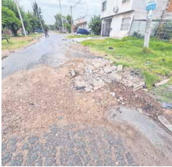
EN 14 Y 81 EL ASFALTO PARECE “DINAMITADO”

Una característica que se viene dando desde hace mucho tiempo, tanto que ya integra las deficiencias endémicas de la Ciudad en materia de desarreglos urbanísticos es la que aparece como denominador común en los testimonios de los vecinos: aunque los pavimentos rajados y poceados se reparen, la mejora no dura nada; a los pocos meses o incluso a las pocas semanas la calzada vuelve a verse destrozada.