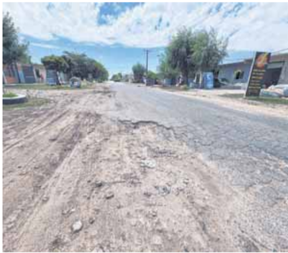
EN 38 Y 152 HAY TRAMOS EN LO QUE YA NI SE VE EL ASFALTO