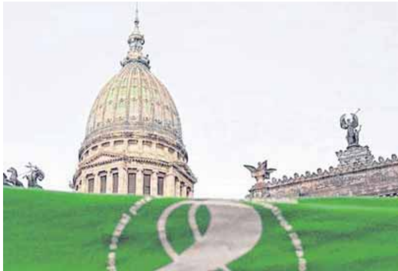
LA LEGALIZACIÓN DEL ABORTO SUFRIÓ EL PRIMER REVÉS JUDICIAL / WEB

Una jueza dio lugar a una demanda cautelar de seis ciudadanos, que aseguraron que va en contra de la Constitución