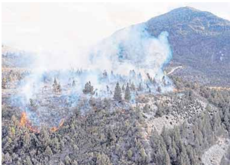
EN LA ZONA SE REALIZÓ AYER UN PRIMER RELEVAMIENTO DE PÉRDIDAS

Durante la conferencia de prensa, la gobernadora aseguró que "garan-