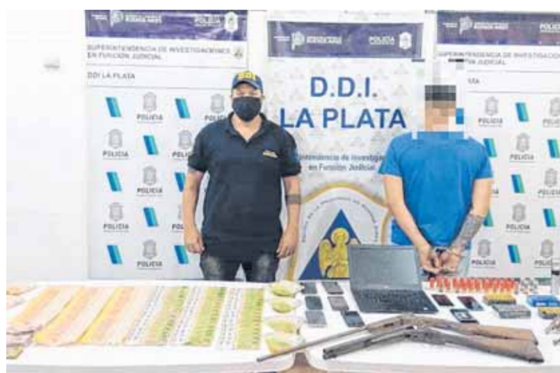
SOSPECHAN QUE EL DETENIDO PARTICIPÓ DEL ASALTO EN 158 Y 476 / EL DÍA