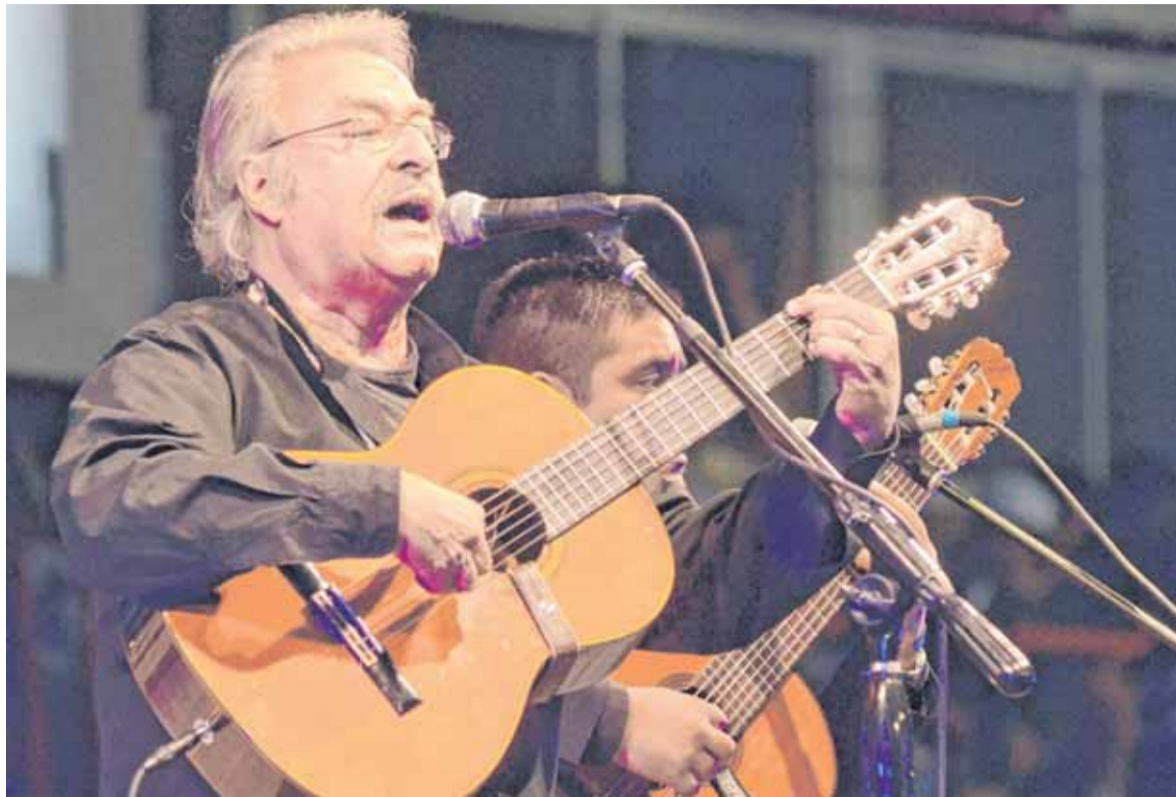
CÉSAR ISELLA, QUE CON SU GUITARRA A CUESTAS DIO VIDA A CLÁSICOS DE LA MÚSICA POPULAR, MURIÓ AYER

LA MÚSICA CRIOLLA PIERDE A UN GRAN REFERENTE