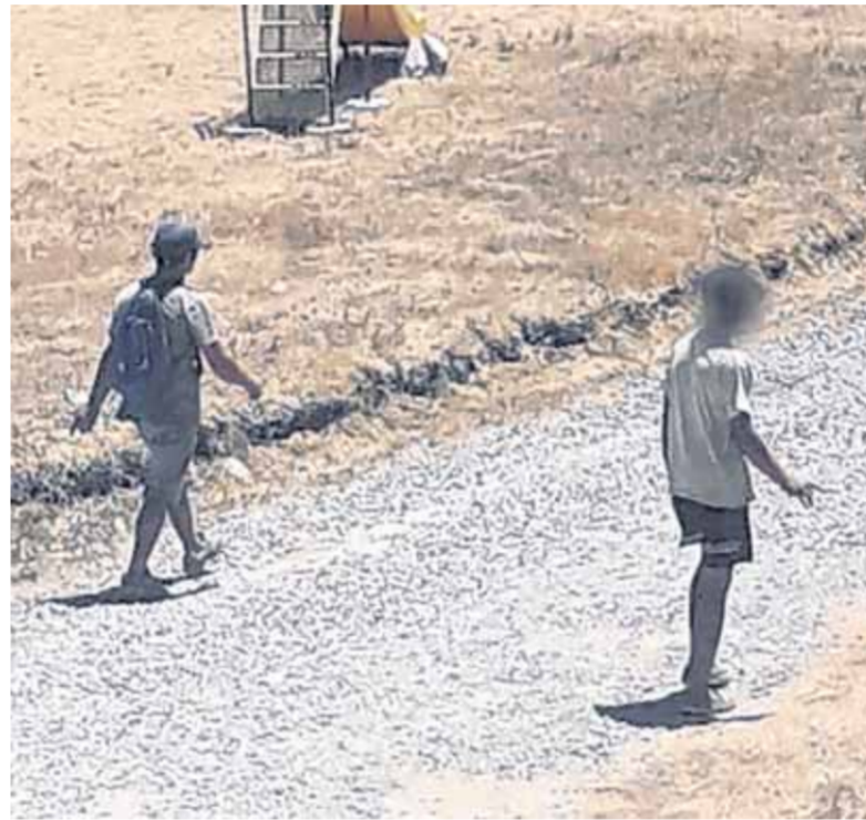
ADEMÁS DE LOS ROBOS, SE DENUNCIAN DESMANES EN LA ZONA